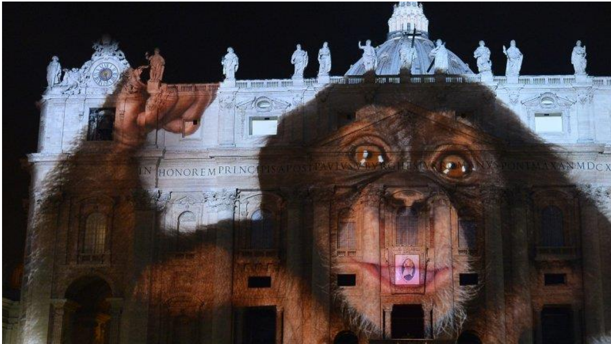
Homenaje del « Santo Padre » a Nuestra Señora el 8 de diciembre de 2015, día de su Inmaculada Concepción. No por casualidad el emblema del « Año de la Misericordia », que comenzaba ese día, se halla situado en la boca del mono...