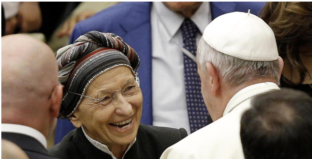
Francisco siempre se regocija en compañía de los enemigos de Dios