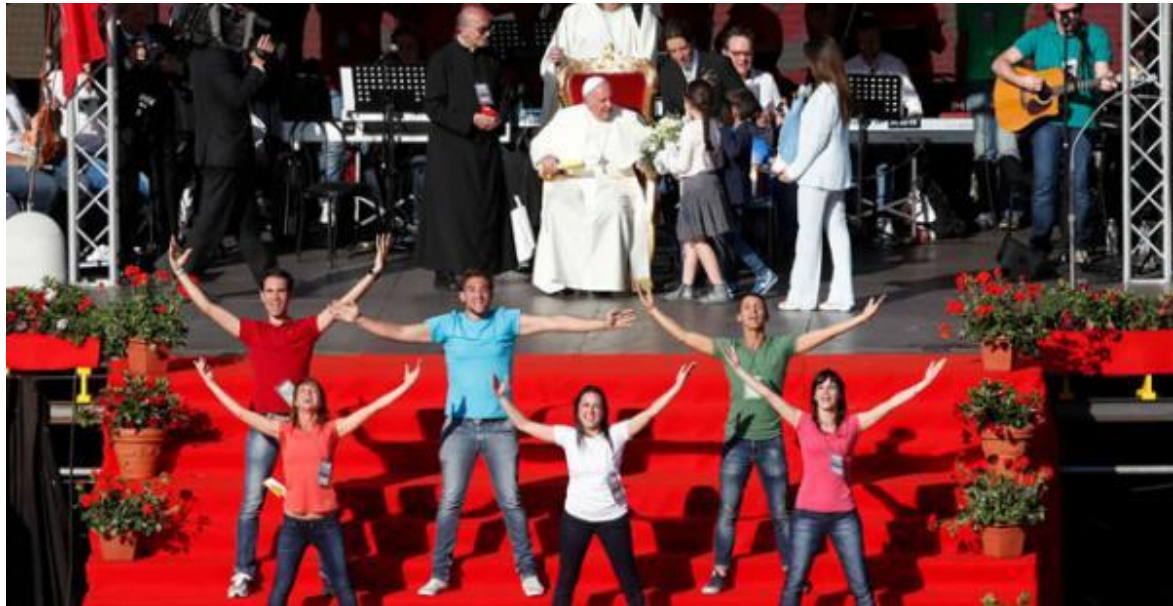
En la Iglesia Bergogliana para la Paz y el Encuentro se vive una fiesta permanente

¿tenemos que firmar un documento para esto?» - “Déjate conducir por el Espíritu Santo. Reza, trabaja, ama, y luego el Espíritu hará el resto 13 .”»