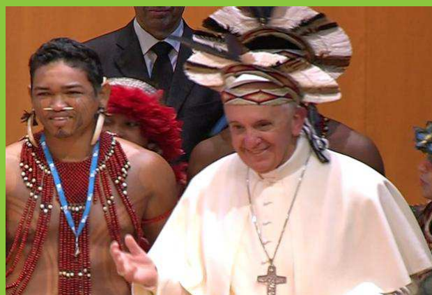
“Si la educación de un chico se la dan los católicos, los protestantes, los ortodoxos o los judíos, a mí no me interesa. A mí me interesa que le eduquen y que le quiten el hambre” (Francisco a “Globo News”, 29/07/2013; http://www.catolicosalerta.com.ar/bergoglio/entrevista.html ). Fotos: Bergoglio enciende la “menorá” en una sinagoga (izq.); con indios en Brasil... (der.).