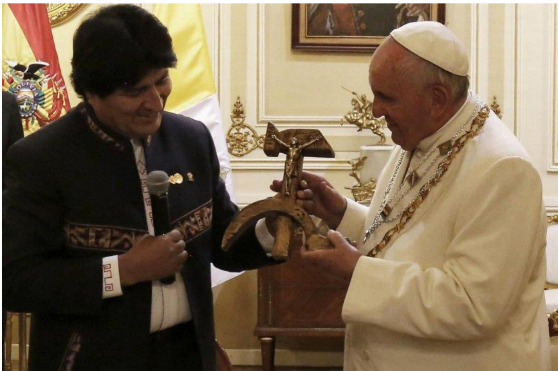
Francisco recibiendo el crucifijo comunista de manos del presidente boliviano Evo Morales

Fiel a su imagen de protector de los pobres, en su exhortación apostólica Evangelii Gaudium , publicada en noviembre de 2013, Francisco condenó enérgicamente la inhumanidad de un mercado