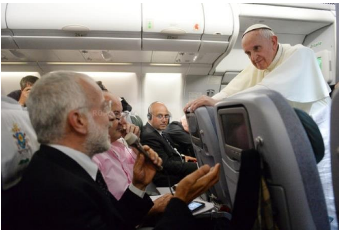
Vuelo de regreso de las JMJ de Río de Janeiro: « ¿Quién soy yo para juzgar? 2 »

Pronto se cumplirán dos años desde que Francisco fue elegido papa, el 13 de marzo de 2013. A lo largo de los meses, multiplicó las declaraciones ambiguas, las frasecitas inquietantes, los dichos escandalosos, las entrevistas revolucionarias, las excentricidades de dudoso gusto, las filípicas acerbas y deliberadamente provocativas contra su clero y la Curia romana, sin hablar de los actos con graves consecuencias (nombramiento de prelados indignos y progresistas, escándalos de las JMJ de Río, « canonizaciones » fabricadas, sínodo de la familia subversivo, maniobras judaizantes en Tierra Santa, « turquerías » en Turquía, reprimendas políticas al Parlamento europeo, desbarajuste programado de la Curia, etc.).