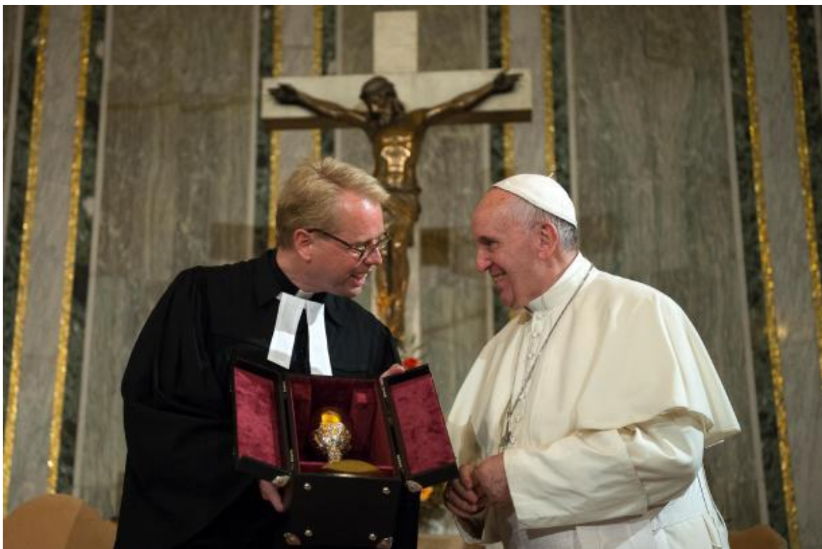
Francisco regala un cáliz a un « pastor » para que celebre la « cena luterana »