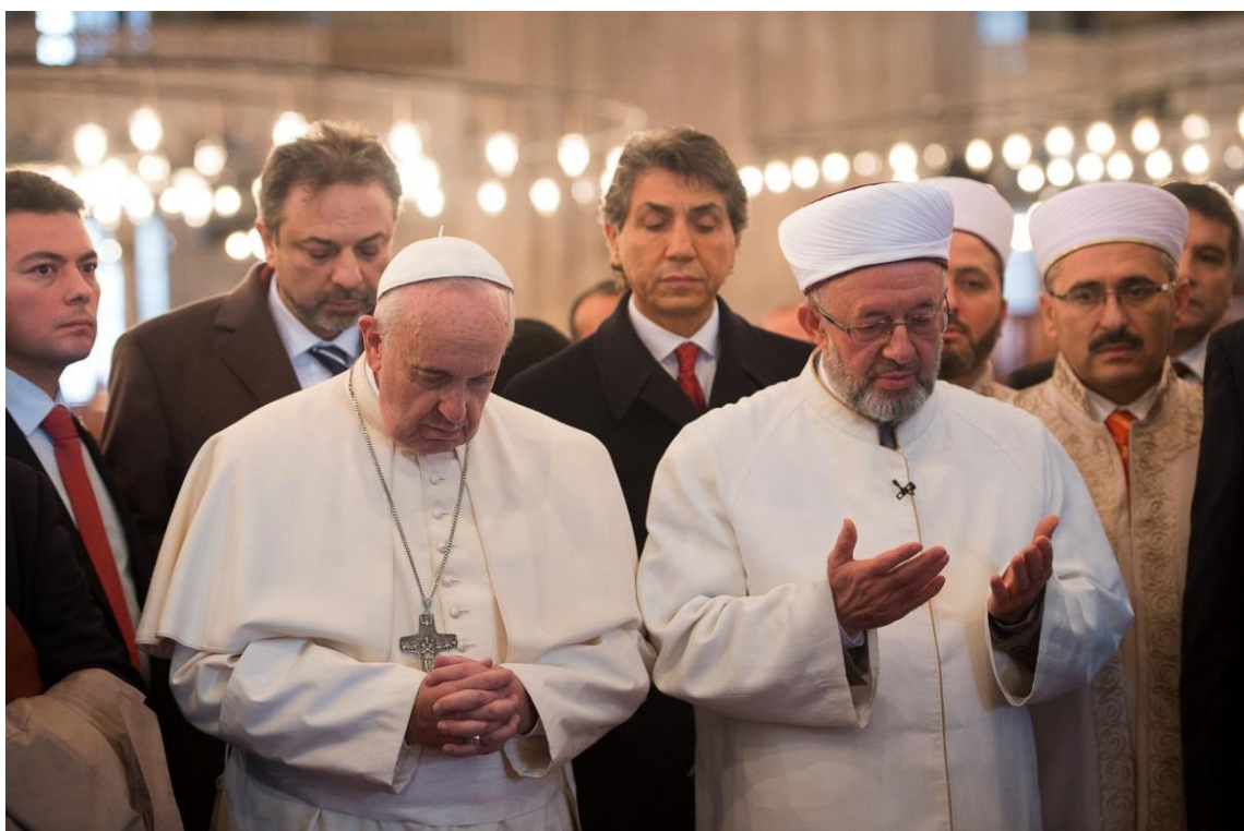
Francisco y el gran mufti rezan juntos en la mezquita azul de Estambul

« Compartir nuestra experiencia de cargar la cruz para arrancar de nuestros corazones la enfermedad que envenena nuestras vidas: es importante que hagan eso en sus reuniones. Los que son cristianos, con la Biblia; los musulmanes, con el Corán. La fe que vuestros padres os han inculcado siempre os ayudará a avanzar. »