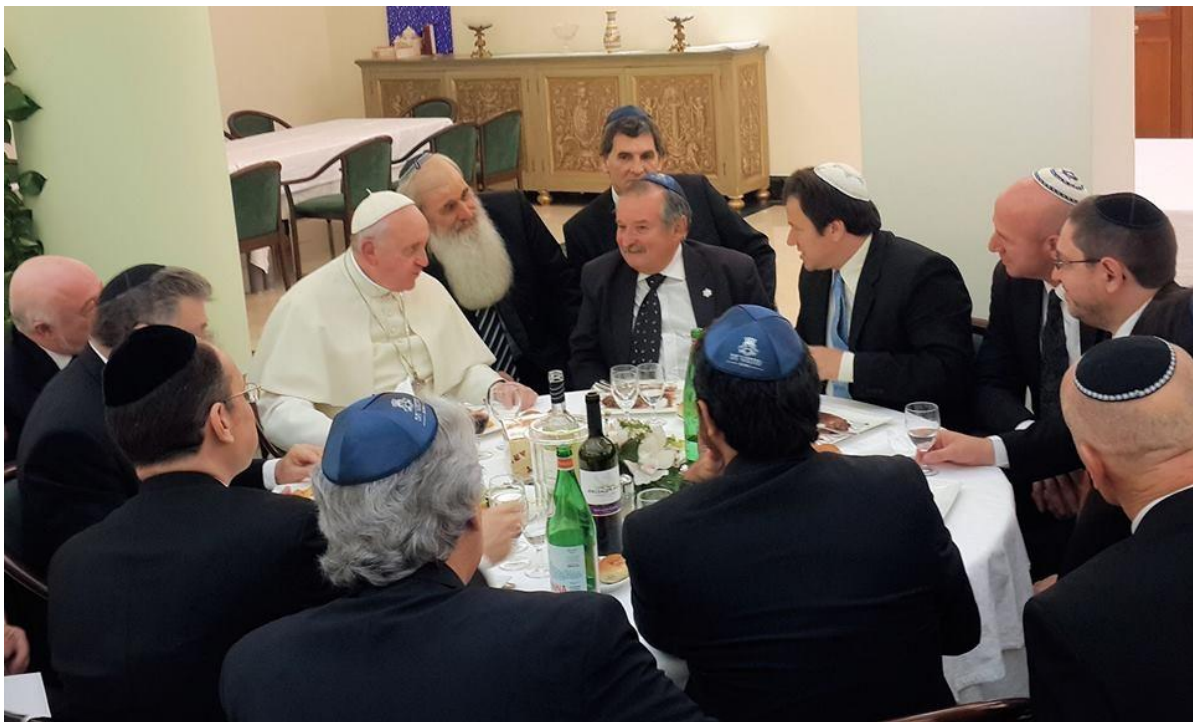
Almuerzo casher en el Vaticano junto a rabinos argentinos

« Mis felicitaciones más fervientes por la gran fiesta de Pesaj. El Omnipotente, que ha liberado a su pueblo de la esclavitud de Egipto para guiarlo a la tierra prometida, siga librándolos de todo mal y los acompañe con su bendición. Les pido que recen por mí. » [Saludos enviados a la comunidad judía de Roma el 25 de marzo de 2013]