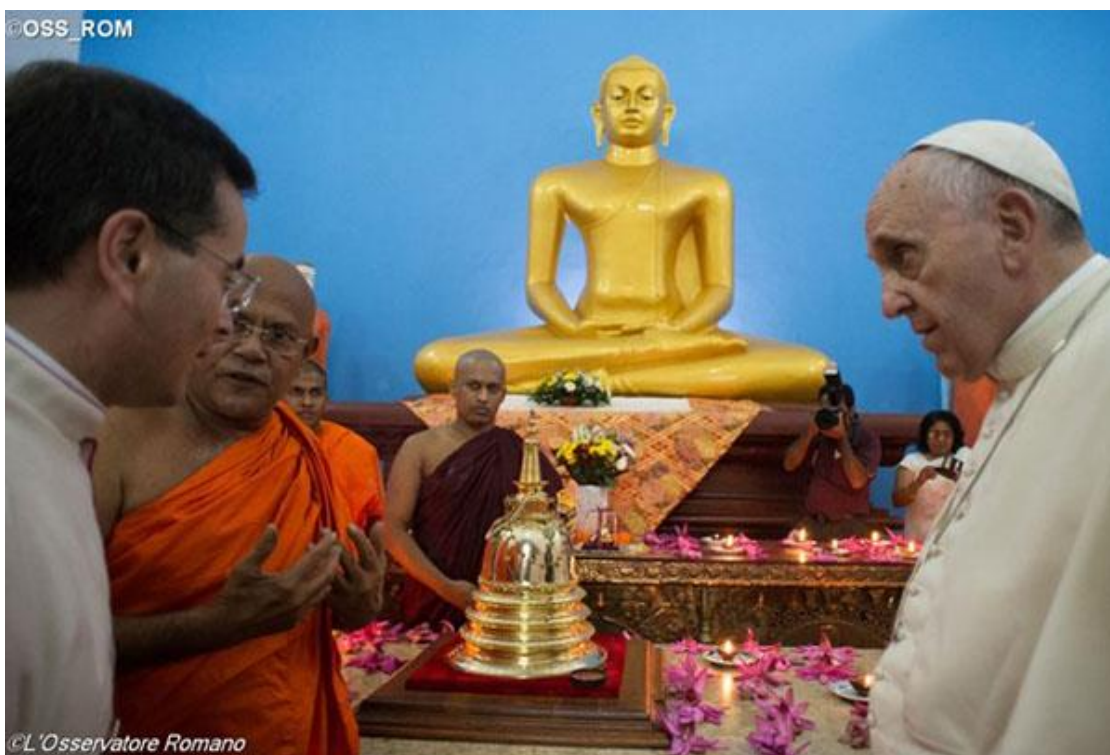
Francisco de visita en un templo budista ante un relicario 4

Comencemos con el diálogo con los no cristianos. En conformidad con la lógica de las teorías formuladas en Nostra Ætate 5 , en Lumen Gentium 6 y por Juan Pablo II 7 , Francisco no duda en