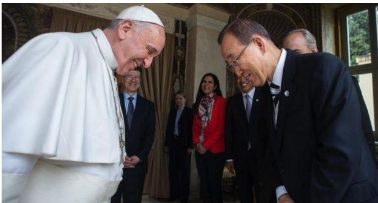
Francisco se inclina ante Ban-Ki-Moon, secretario general de las Naciones Unidas

« Para luchar contra esta deriva de las guerras tenemos a la ONU. Es una institución política que no tiene ni las armas de las que disponen las naciones ni la convicción que engendra la religión. Entonces, tomando nota del hecho de que la ONU es cosa del pasado, lo que sería útil es una organización de religiones unidas, una ONU de las religiones. » [Shimon Peres entrevistado por la revista Famiglia Cristiana ]