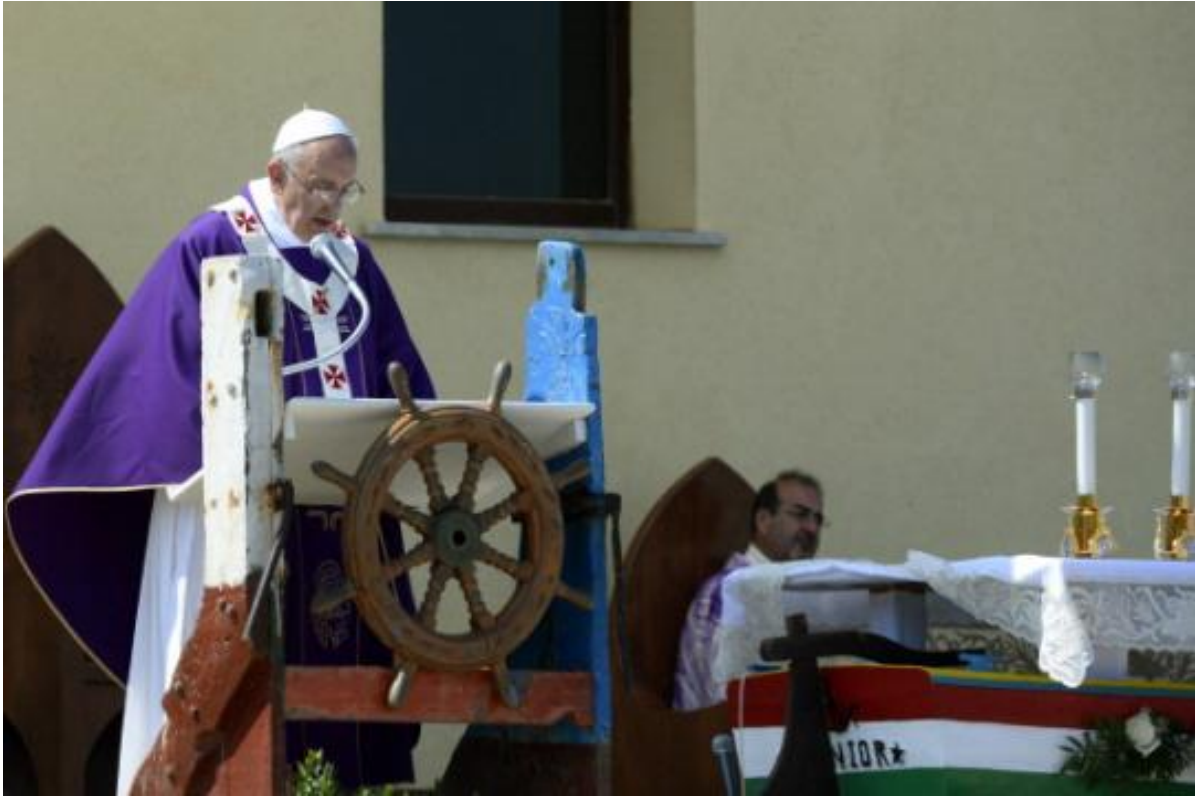
Francisco predicando en Lampedusa desde un atril hecho con restos de barcos naufragados

Entre los excluidos de los cuales Francisco es un defensor entusiasta los inmigrantes gozan de una particular predilección de su parte: